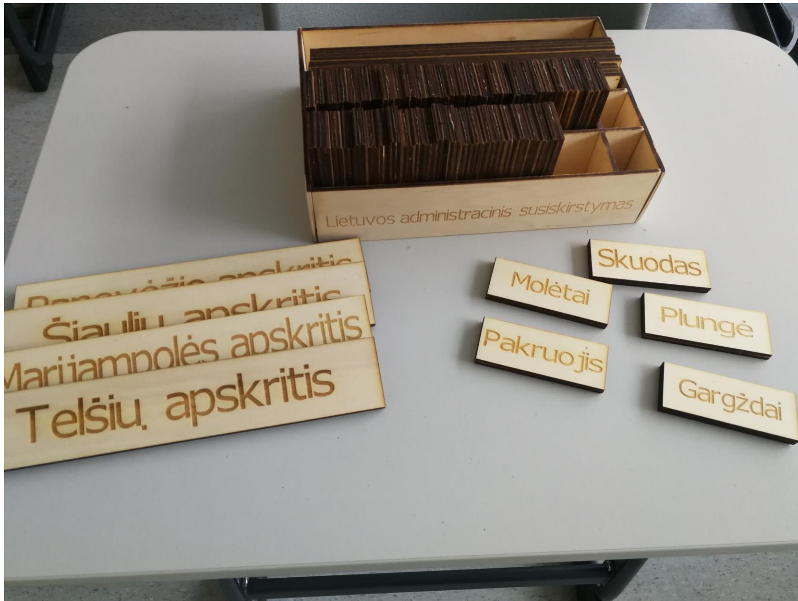
Lentelės su apskričių ir rajonų centrų pavadinimais ant žemėlapių tvirtinami magnetais.